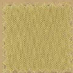
8D FIENO •