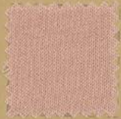
JO SPARKLY •