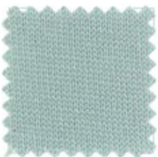
COUNTRY Ne 30/2 (Nm 2/50) Ne 30/3 (Nm 3/50) 100% cotone organico certificato GOTS