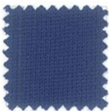
GALASSIA Ne 30/3 (Nm 3/50) Ne 30/2 (Nm 3/50) Ne 20/2 (Nm 2/34) 100% cotone pettinato 140 colori uniti - stock service