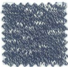
MARL RIF. 101 Ne 30/3 (Nm 3/50) 100% cotone