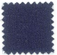
MOSSO Nm 15000 Mosso Light Nm 27000 Mosso Grosso Nm 2000 65% cotone 35% poliammide