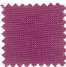
GHOST Ne 80/2 (Nm 2/135) 100% cotone ELS 21 colori stock service