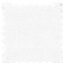
CRISPY Ne 30/2 Nm(2/50) Ne 30/3 Nm (3/50) 100% cotone compact crêpe 23 colori stock service