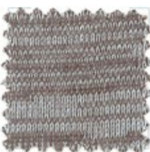
STRIPE Nm 23000 95% cotone 5% nylon