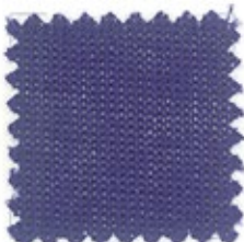
NEW YUMA Ne 40/3 (Nm 3/68) Ne 40/4 (Nm 4/68) Ne 40/2 (Nm 2/68) 100% cotone Pima/Giza 60 colori stock service