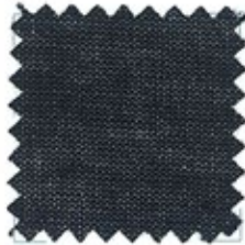
BUTTERFLY Ne 110/3 (Nm 3/190) 100% cotone ELS compact