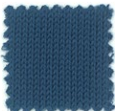
UNIVERSAL Ne 40/10 (Nm 6800) Ne 40/4 (Nm 4/68) Ne 40/3 (Nm 3/68) Ne 40/2 (Nm 2/68) 100% cotone compact 84 colori stock service