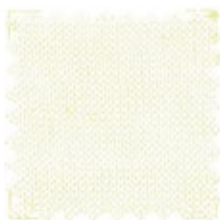
FRESCO Ne 60/3 (Nm 3/100) 100% cotone ELS semi-crêpe 24 colori stock service