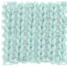
BIG 2 Nm 2000 100% cotone gasato mercerizzato