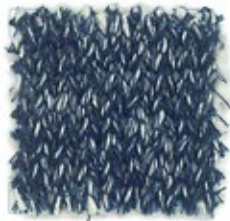
SMART Nm 2400 100% cotone