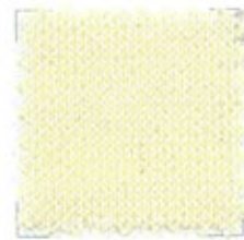
BIG 8 Nm 8000 100% cotone gasato mercerizzato