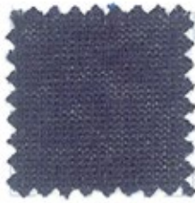
FLORIDA Ne 30/2 (Nm 2/50) Ne 30/3 (Nm 3/50) Ne 20/2 (Nm 2/34) 100% cotone pettinato 42 colori melange - stock service