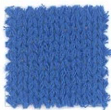
FETTUCCIA GALASSIA/FLORIDA Nm 3300 Nm 2700 100% cotone pettinato