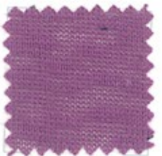
FLAMED Ne 30/2 (Nm 2/50) Ne 30/3 (Nm 3/50) 100% cotone pettinato fiammato