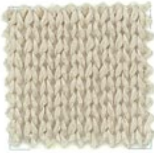
BIG 3 Nm 3200 100% cotone gasato mercerizzato