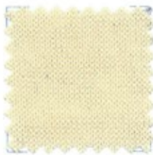
GALASSIA CRÊPE Ne 30/2 Nm(2/50) Ne 30/3 Nm (3/50) 100% cotone peltinato crêpe