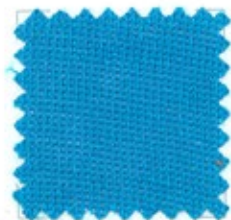
SATIN Ne 32/2 (Nm 2/54) Ne 32/3 (Nm 3/54) 100% cotone gasato mercerizzato 22 colori stock service