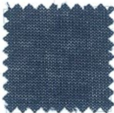
SIXTY Ne 60/2 (Nm 2/100) Ne 60/3 (Nm 3/100) Ne 60/4 (Nm 4/100) 100% cotone ELS compact 17 colori stock service