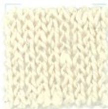
MARL RIF. 147 Ne 2/3 (Nm 3200) 100% cotone