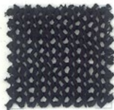
BIG 4 Nm 4000 100% cotone gasato mercerizzato