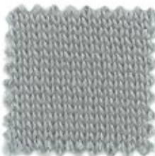
WED Ne 32/2x4 (Nm 6800) Ne 32/2x6 (Nm 4500) 100% cotone gasato mercerizzato