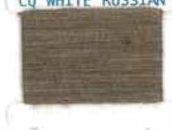
CQ WHITE RUSSIAN