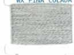
WX PINA COLADA