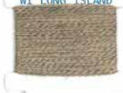
WT LONG ISLAND