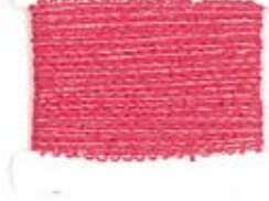
VH AZALEA S