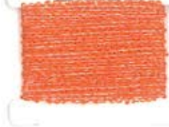
L3 KAKI M