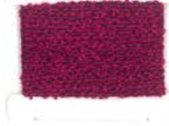
8T CICLAMINO SP