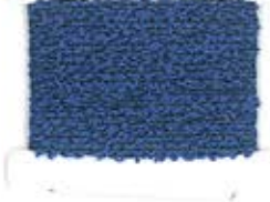
9D AMETISTA S