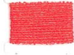
ZL AGRUMI SS