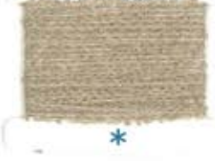
50 BEIGE M