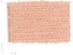
J0 SPARKLY M